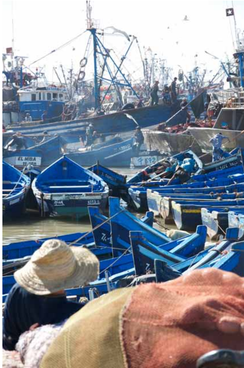
Claudio Falcone Foresta Essaouira, Marocco - 2011