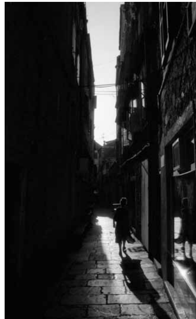
Claudio Falcone Donne allo specchio Spalato, Croazia - 1998