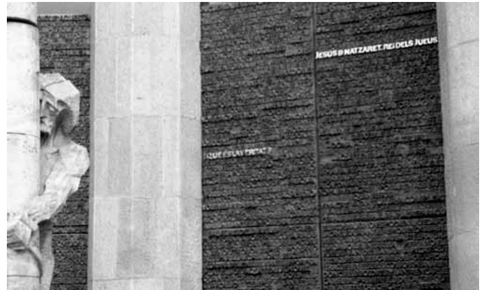
Claudio Falcone Dov'è la veritat? Barcelona - 2001